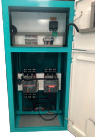
TABLERO DE CONTROL Y TRANSFERENCIA MCA GP TIPO AUTOSOPORTADO MODELO GP-C TIPO NEMA1

El tablero de transferencia automático modelo GP-500 (220V) formado por interruptores electromagnético de 1600 Amp. tiene la función de arrancar, parar, proteger tanto el motor diesel como el generador eléctrico y hacer la transferencia y retransferencia de la carga de la red de CFE a la planta y viceversa por medio del módulo de control DSE-7320. Todo esto de forma automática o manual.