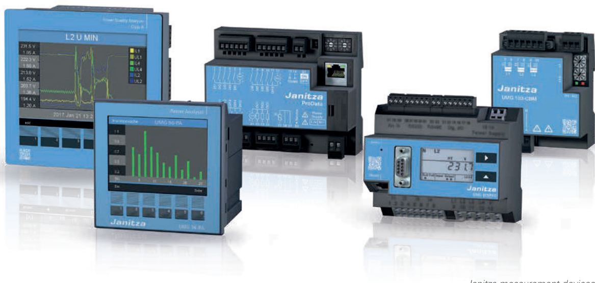
Janitza measurement devices