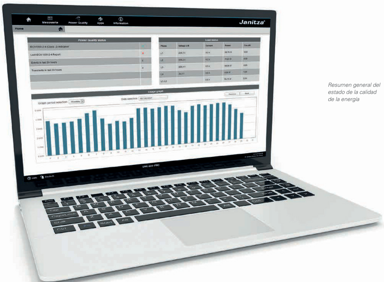
Resumen general del estado de la calidad de la energía

datos de medición, sin instalación previa de software. El usuario obtiene inmediatamente una visión general de todos los datos de energía. La representación de la página de inicio del dispositivo es posible en todos los dispositivos y se adapta según las funciones del dispositivo (diseño tipo responsive). El diseño uniforme del software de visualización GridVis® y la página de inicio del dispositivo posibilitan un manejo sencillo.